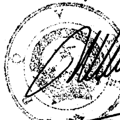
Nguyễn Thị Kim Tiến